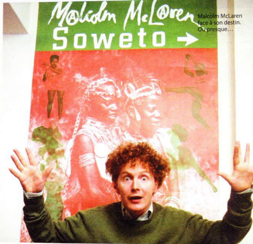
Malcolm McLaren face à son destin. Ou presque...

30. Muddy Waters meurt d'une crise cardiaque chez lui à Chicago.