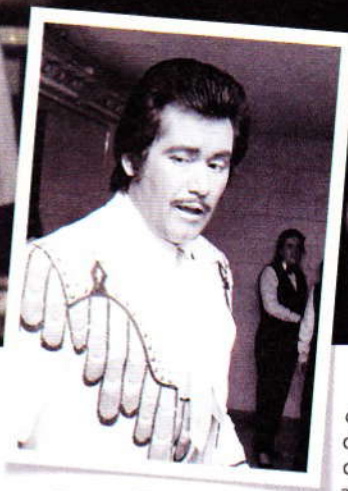
Rencontre présidentielle : les Beach Boys avec Nancy et (à l'extrême droite) Ron ; (en haut) Wayne Newton ; (en bas) James Watt.