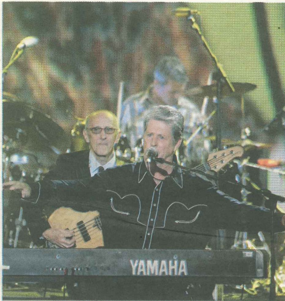
Brian Wilson sur la scène de l'Alexandra Palace, à Londres, le 14 novembre 2006.

Brian Wilson, 20h, Grand Rex, 1, bd Poissonnière, Paris 2 e .