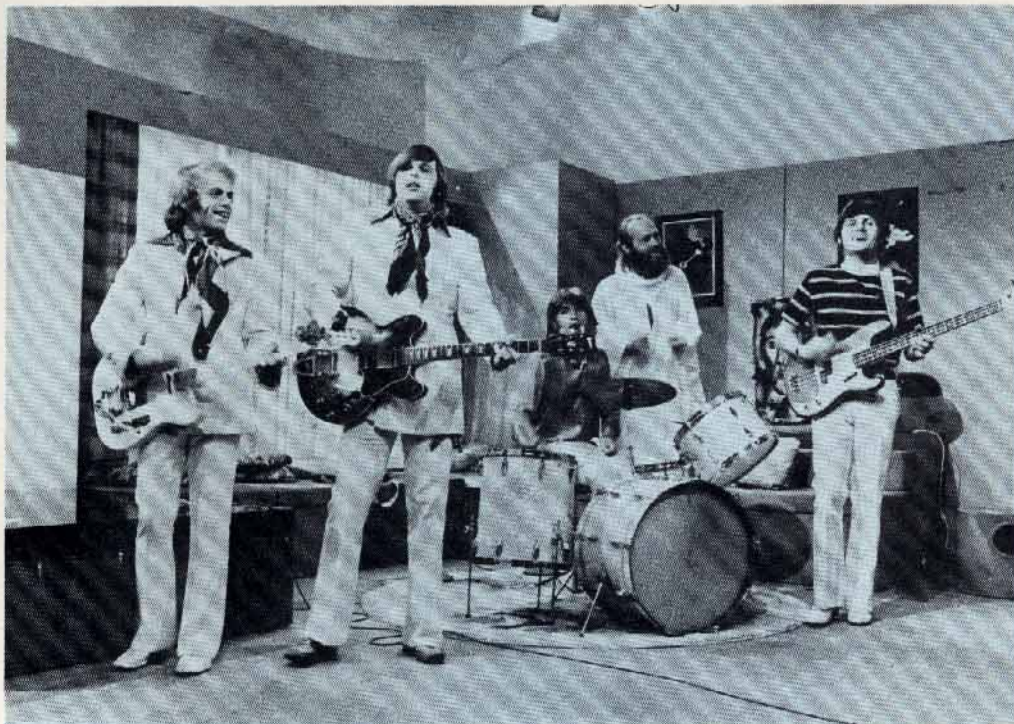
Les Beach Boys