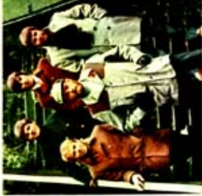
Les Beach Boys